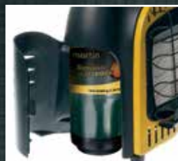
Un compartiment fermé abrite la bouteille de propane