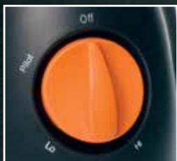
Choix de température