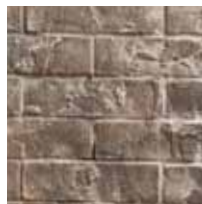
Traditional briques réfractaires RLT