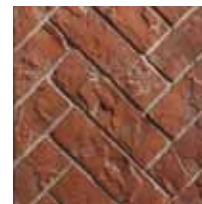
Herringbone Rouge briques réfractaires RRH