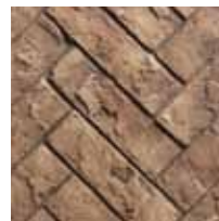
Herringbone briques réfractaires RLH